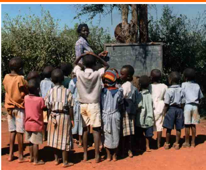
lezione sotto l'albero