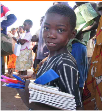
distribuzione kit scolastici