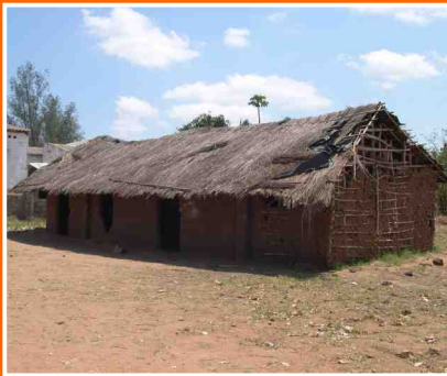
scuola rurale mozambicana