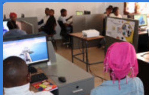
GIOVANI IN AZIONE

Si impegna a migliorare la salute mentale e la qualità della vita delle persone vulnerabili nei distretti di Moche e Salaverry, a Trujillo (Perù), rafforzando l'assistenza sanitaria con nuove infrastrutture e percorsi di formazione professionale, e promuovendo campagne di prevenzione sulla salute mentale attraverso attività scolastiche e iniziative sociali.