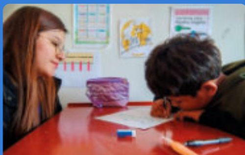
A MENTE APERTA

A Trujillo (Perù) molti studenti con disabilità restano esclusi per mancanza di docenti formati, strutture adeguate e reale applicazione delle norme. L'iniziativa rafforza competenze degli insegnanti, accessibilità delle scuole e coinvolgimento delle famiglie, favorendo autonomia, inclusione e valorizzazione di ogni bambino.