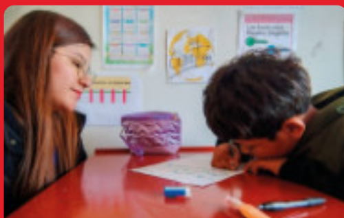
A MENTE APERTA

Evoluzione del progetto EWA Energy with Africa, mira a offrire formazione professionale agli studenti e ai neolaureati dell'Università di Labé in Guinea, oltre che ai membri della comunità locale. Propone un modello educativo mirato, in grado di rispondere alle esigenze del mercato del lavoro e di favorire un rapido inserimento professionale.