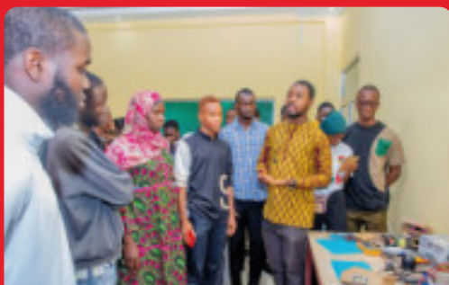
EWA - EMPOWERING WORK ACTIONS

Per continuare a costruire insieme un mondo più equo e giusto, un pezzo per volta